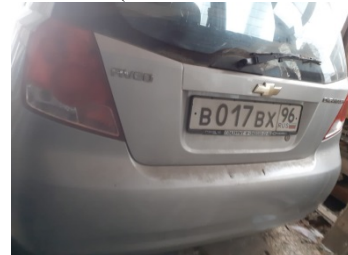
Chevrolet Aveo (VIN KLISF487J6B631591)